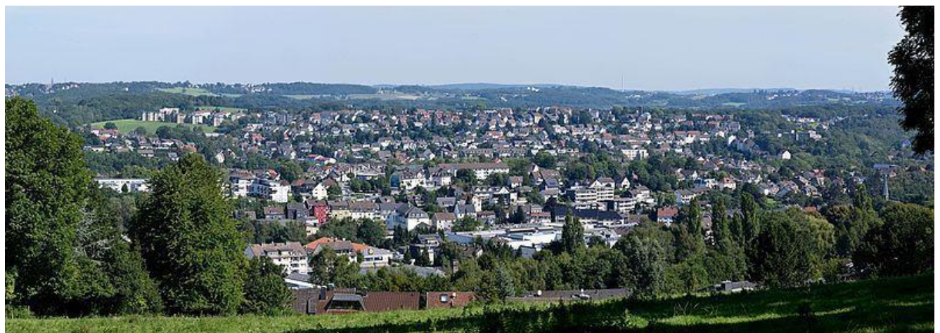
Panoramaaufnahme der Stadt Gevelsberg