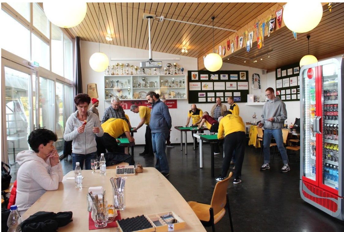
Das Restaurant Corner in Herzogenbuchsee war für die Spiele bestens geeignet. Es gab eine grosse Auswahl von Speisen und Snacks sowie jede Menge Getränke. Für eine gute Stimmung war somit gesorgt.