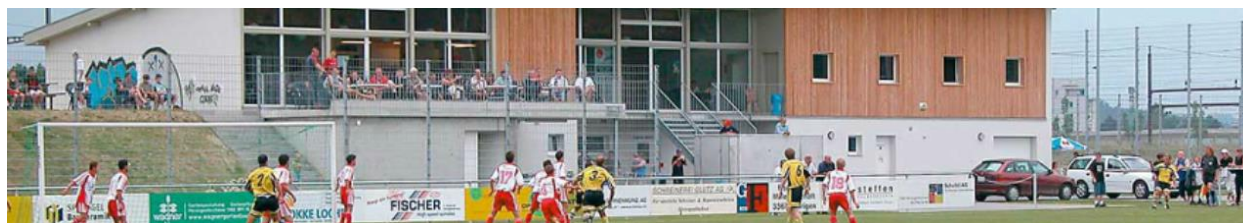
Sportplatz des FC Herzogenbuchsee mit Terrasse des Restaurants Corner

Auf den Seiten 5 bis 7 dieses Informationsbulletins sind die Einzelergebnisse der drei Vergleichskämpfe der SMM 2018 in Herzogenbuchsee ersichtlich.