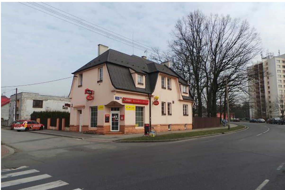
Das Restaurace U Stružků in Nový Bohumín, Austragungsort des Turniers.