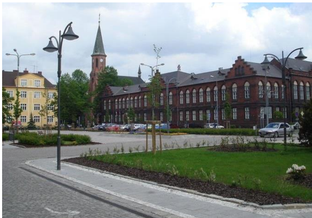
Der Masaryk-Platz und das Rathaus in Nový Bohumín