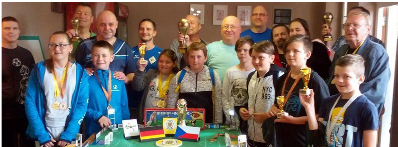
Die Teilnehmerinnen und Teilnehmer am 2. Slezský Pohár verbrachten am 23. Juni 2018 gemeinsam einen schönen Tag beim Spiel auf den grünen Filzplatten.