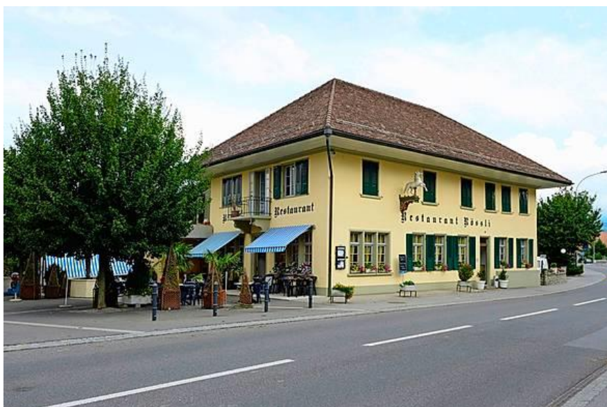
Das Restaurant Rössli in Uetendorf